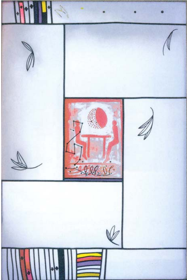
Titelbild: „Menschen an einem Tisch“ Glasfenster von Johannes B. Hewel in der Kapelle der Evangelischen Akademie in Bad Herrenalb. Die Kapelle konnte dank der Spenden des Freundeskreises künstlerisch ausgestaltet werden.

Der Freundeskreis der Evangelischen Akademie Baden e. V. (gegründet 1949) unterstützt die Arbeit und Fortentwicklung der Evangelischen Akademie. Er setzt sich für die Akademiearbeit als Ort des offenen Dialogs zwischen Kirche und gesellschaftlichen Gruppierungen ein. Der Freundeskreis vertieft die Verbindung zwischen Akademie und Tagungsteilnehmern.